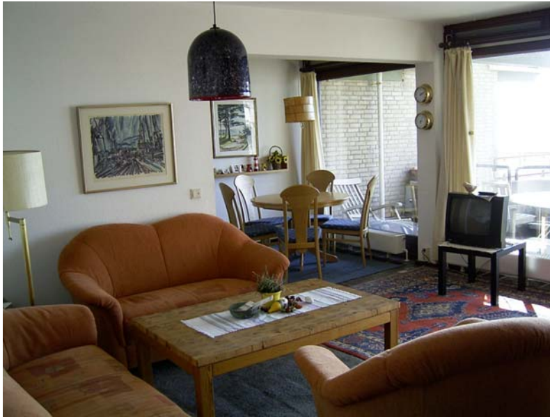
Wohnzimmer mit Blick in die Essecke Blick vom Balkon